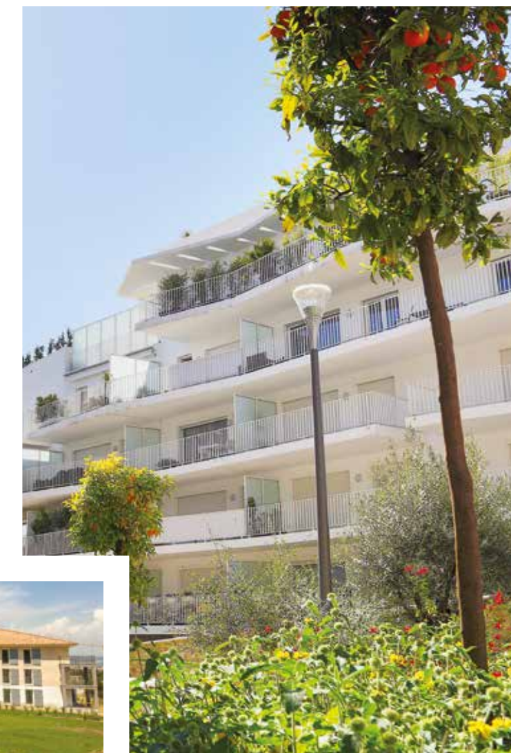
LOGEMENTS - Cannes Maria - CANNES