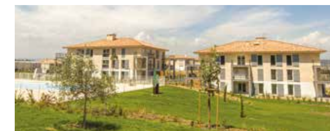
LOGEMENTS - Only Roc - ROQUEBRUNE-SUR-ARGENS

Acteur local et régional engagé aux côtés de ceux qui, chaque jour, contribuent à façonner le visage des villes et territoires de demain, VINCI Immobilier compte parmi les intervenants économiques majeurs en Région Sud avec des réalisations qui font référence dans la région. Pour vous, la garantie de pouvoir compter sur une réelle proximité.