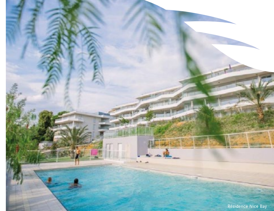
Résidence Nice Bay

Parce que la satisfaction client est pour nous une priorité, VINCI Immobilier crée VINCI Immobilier 4YOU et s'engage sur la maîtrise des détails et la qualité de livraison de logement.