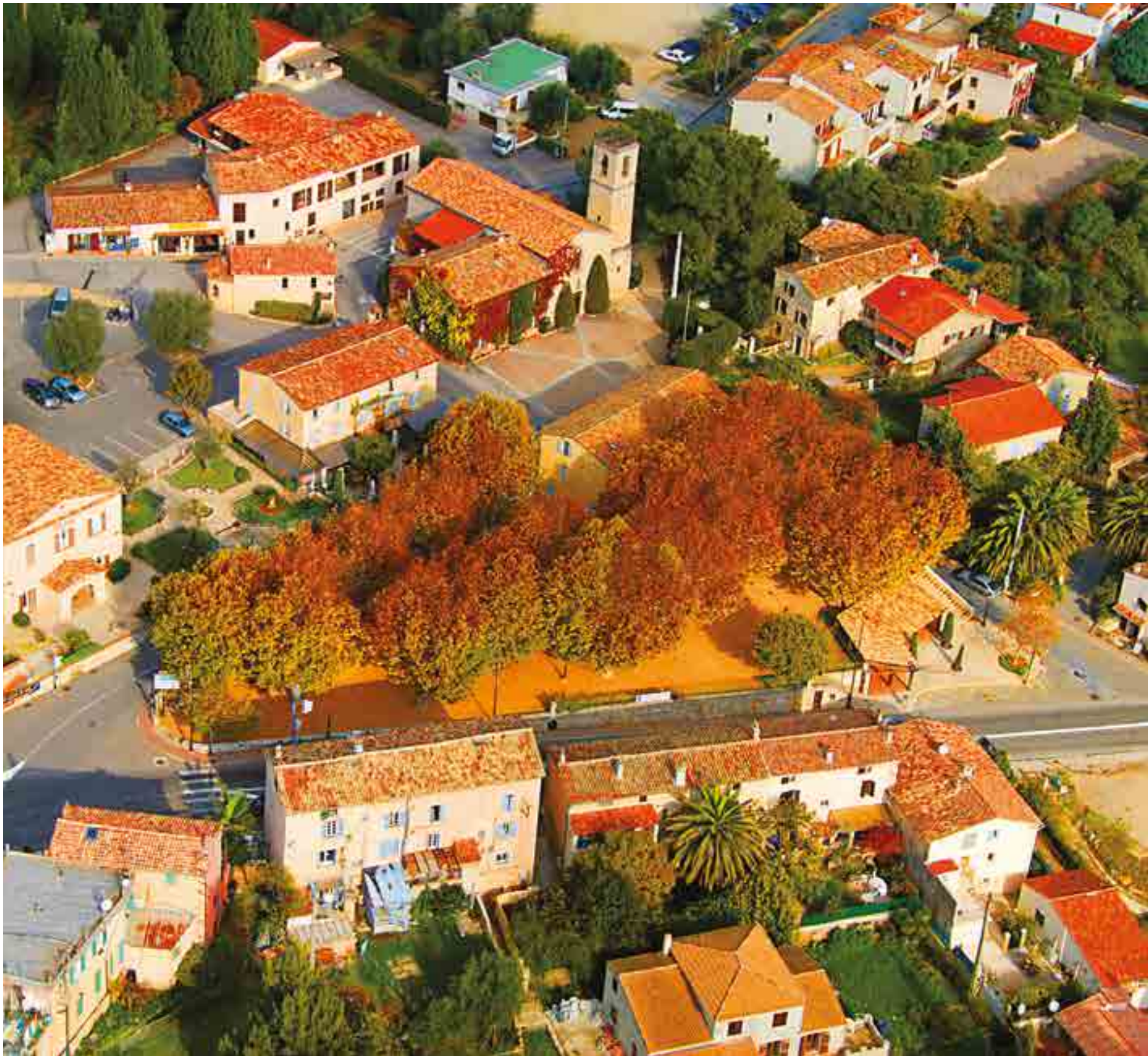
Vue de la place du village