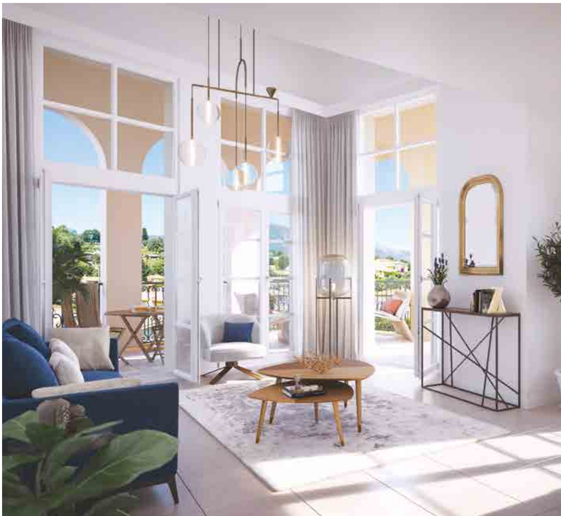
Vue du séjour du duplex n°C202