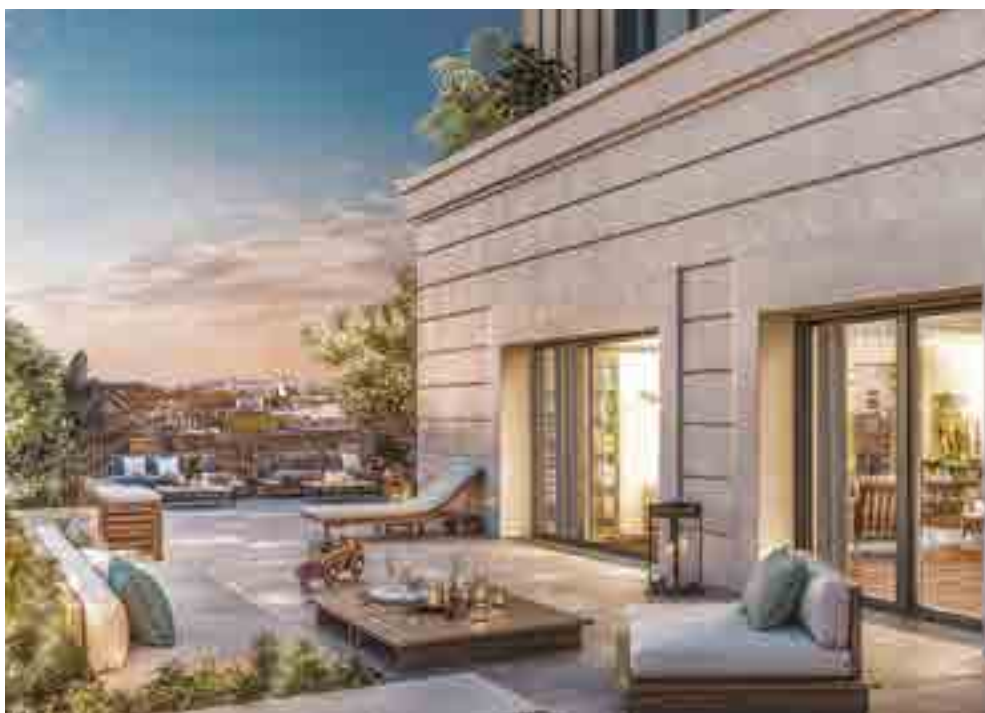
Vogue - SAINT-OUEN-SUR-SEINE | 93 en co-réalisation avec BNP Paribas Immobilier