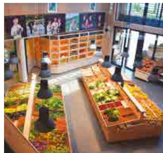
Le Marché de nos Collines - Coopérative Agricole