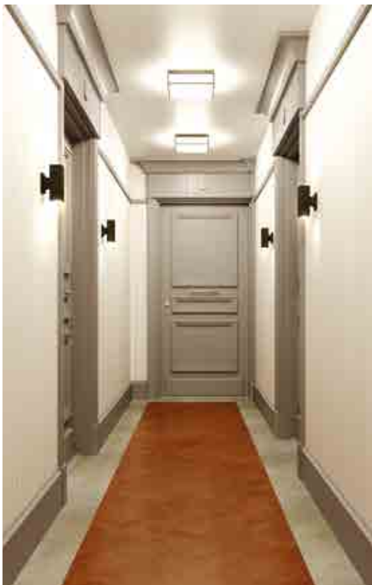
Vue d'un palier d'étage