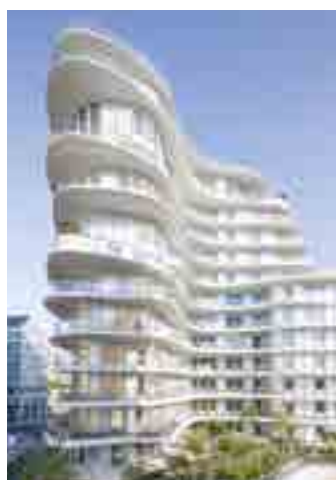
Unic - PARIS | 17