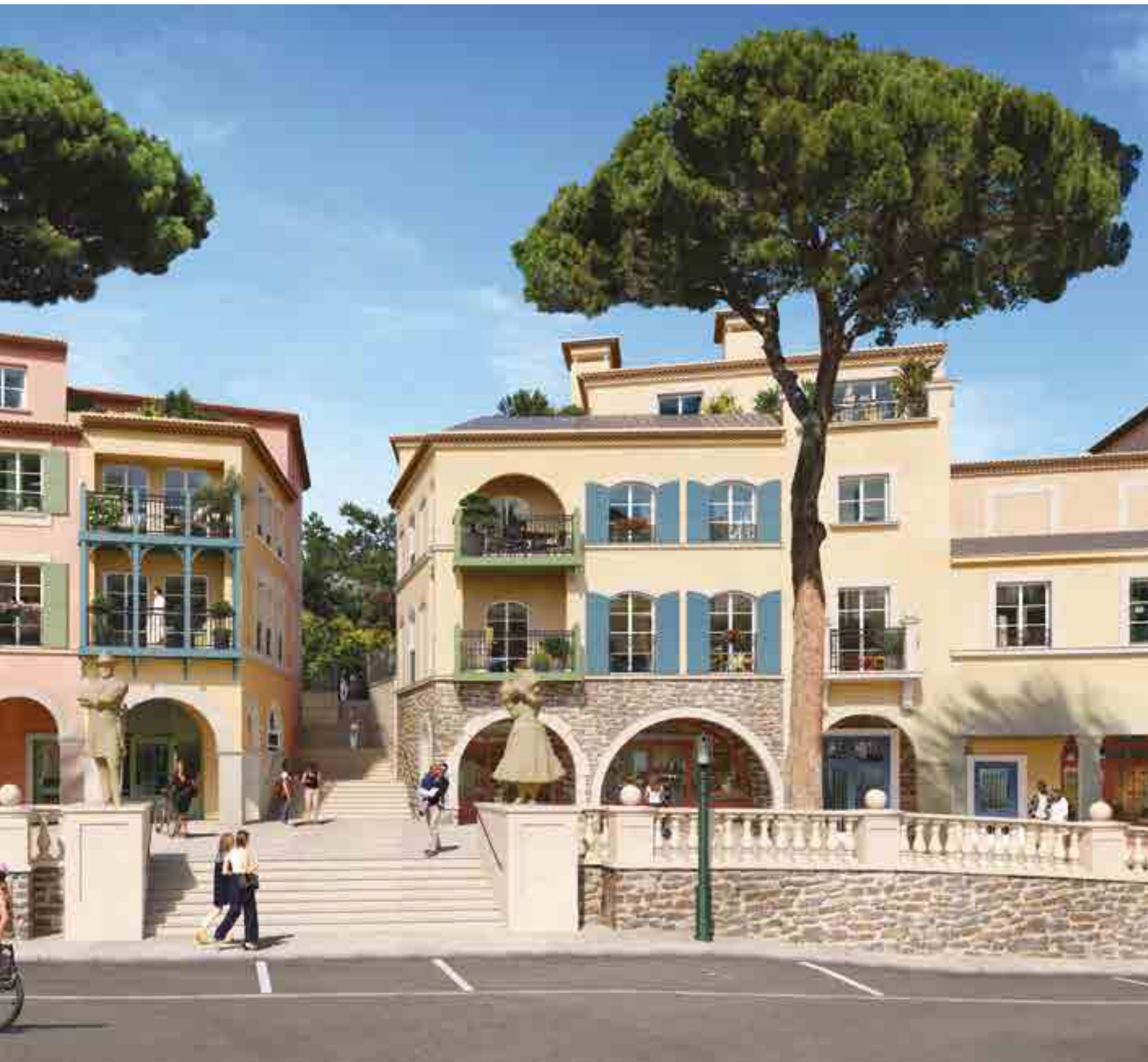
Vue sur la placette depuis la route de Nice