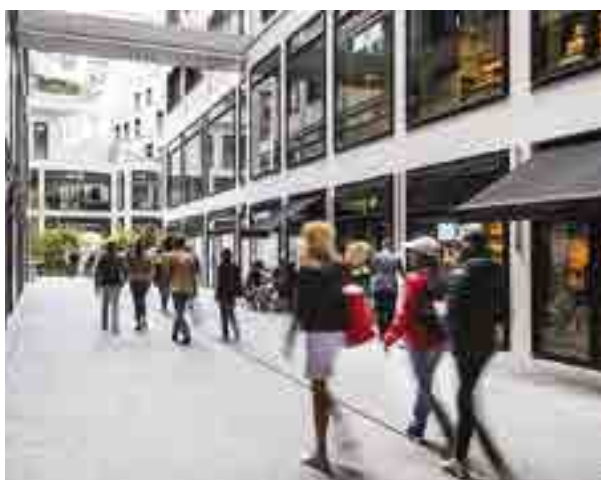
Beaupassage - PARIS | 7