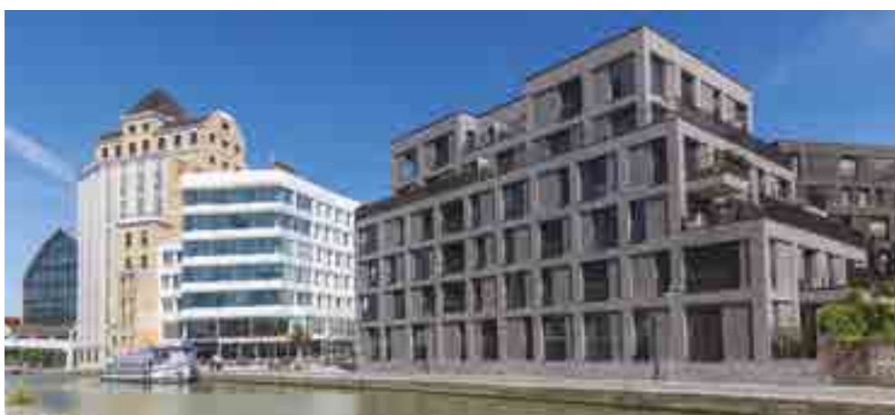
10 rue Danton - PANTIN | 93

Pour Emerige, chaque nouveau projet immobilier répond à une quête d'exigence en matière de qualité et de durabilité architecturale. Tous conçus comme des lieux de vie partagés, ils visent en priorité la satisfaction des habitants et des usagers pour un mieux-vivre ensemble.