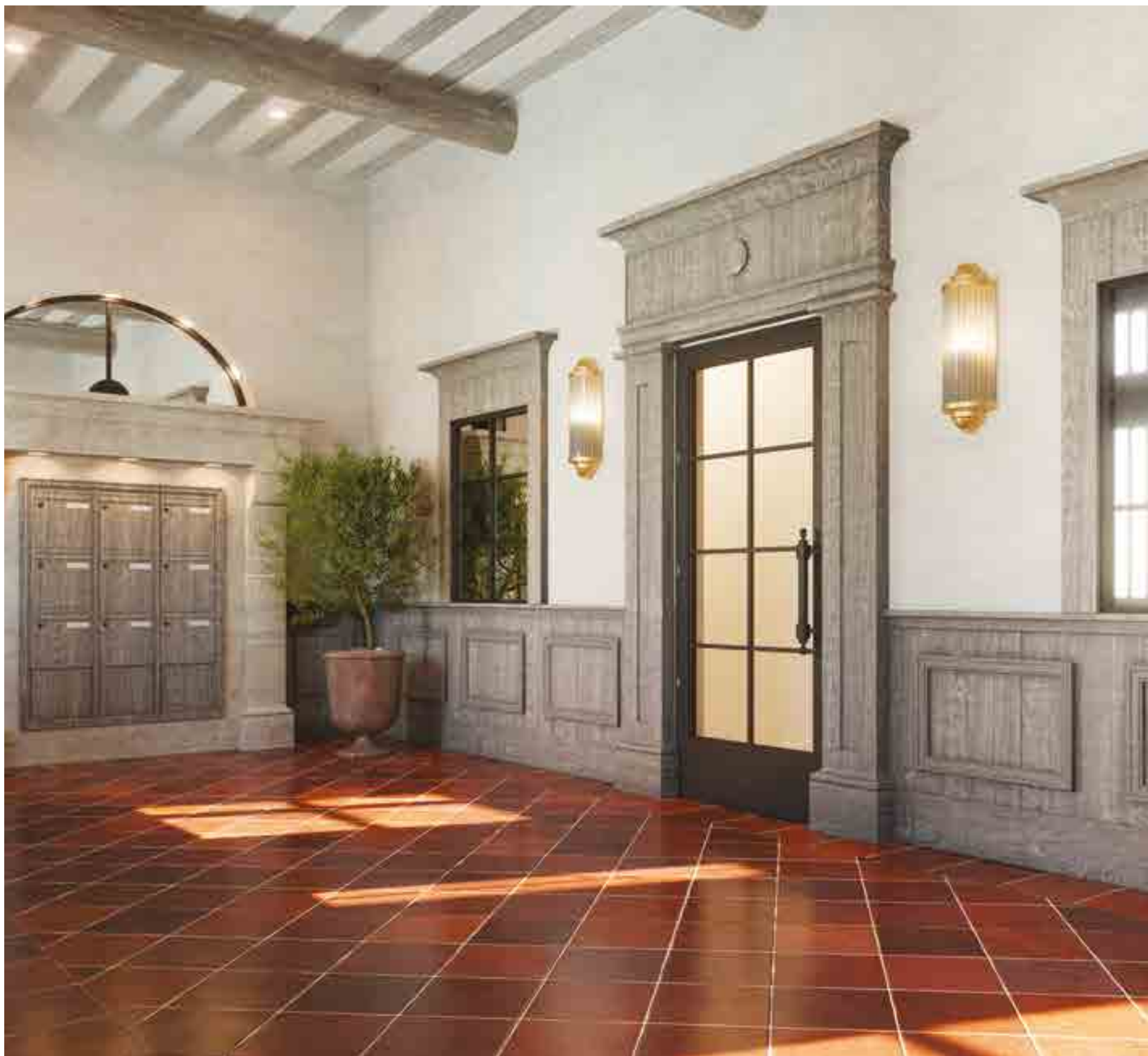
Vue depuis le hall du bâtiment B