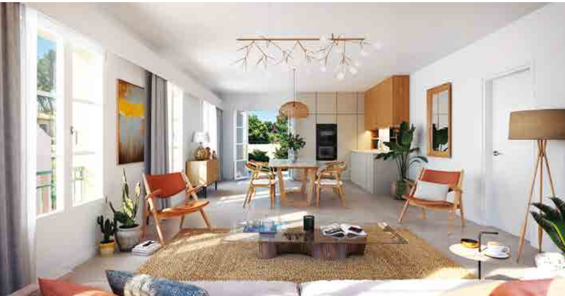
Vue du séjour n°C302