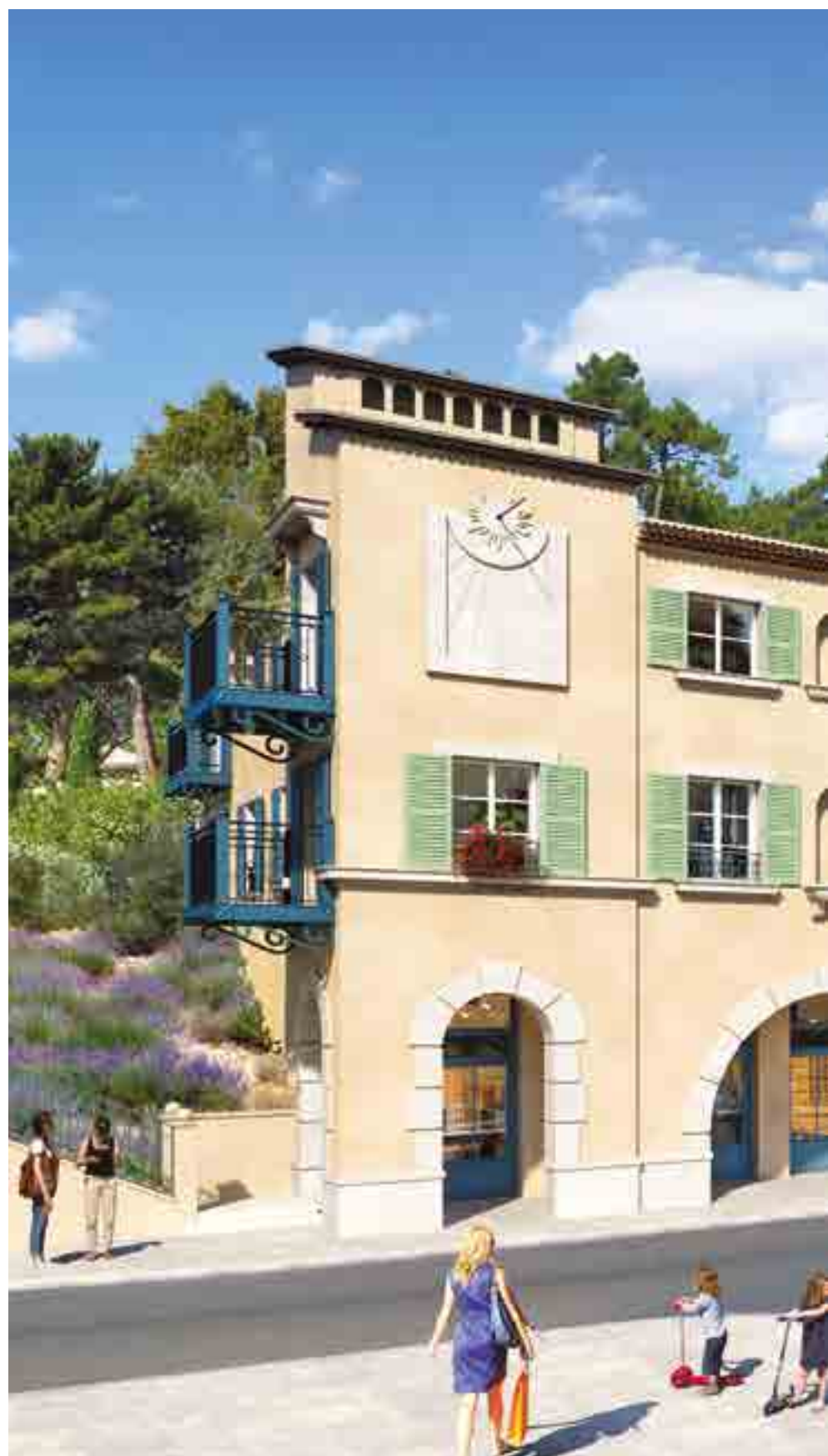
Vue depuis la route de Nice

Pour terminer en beauté, de petites niches prévues dans certains bâtiments accueillent des sculptures dans la plus pure tradition locale.