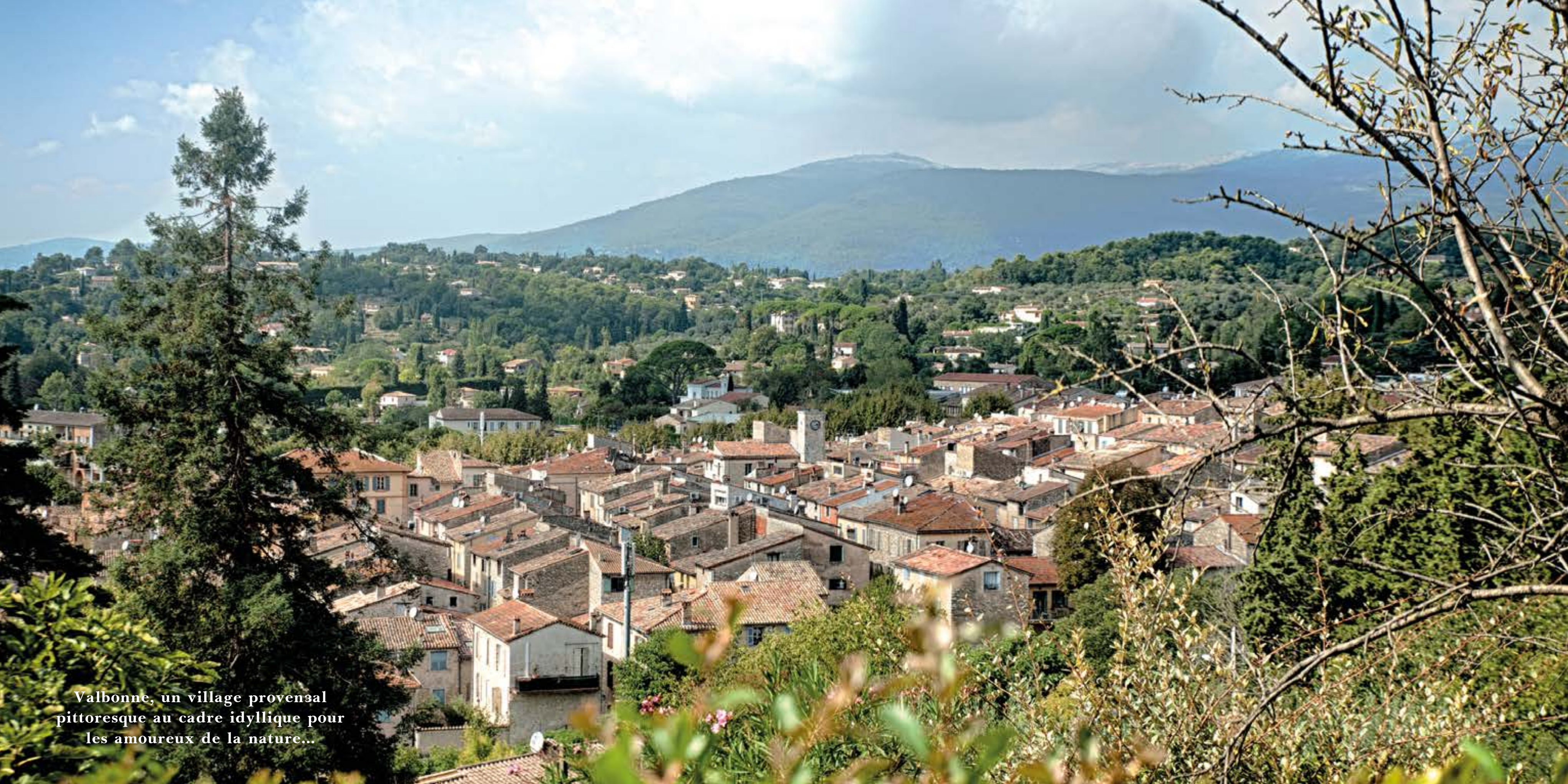
Valbonne, un village provençal pittoresque au cadre idyllique pour les amoureux de la nature...