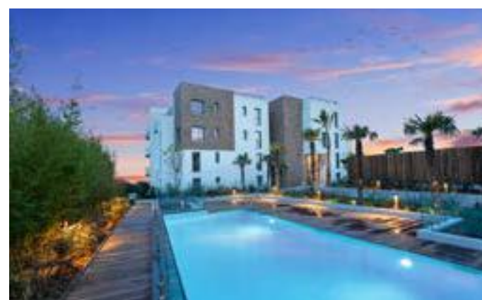
Le Panoramic - Antibes Architecte : Atelier Gosselin