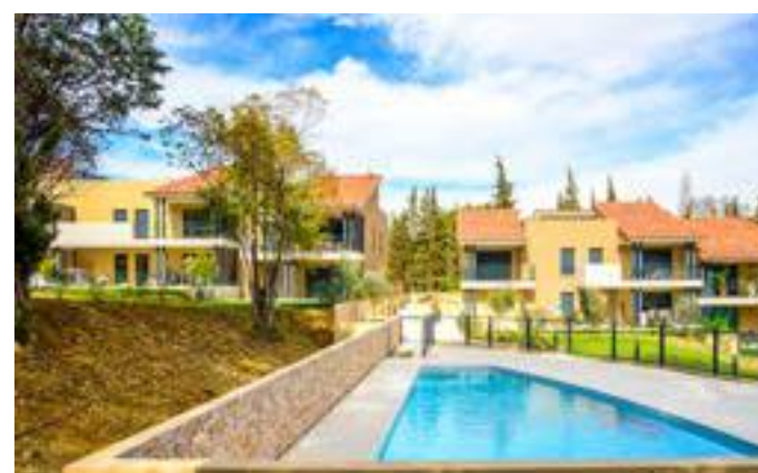
Domaine Saint-Basile - Mougins Architecte : ABC Architectes