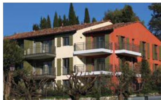
Esprit Village - Valbonne Architecte : ABC Architectes