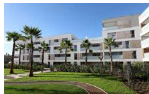
Le Jardin de Matisse - Saint-Laurent-du-Var Architecte : Cabinet Es-Pace