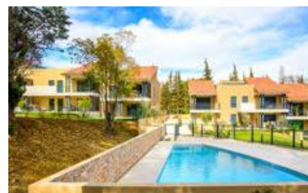
Les Jardins de Valmasque - Mougins Architecte : ABC Architectes