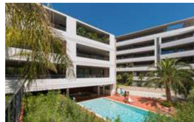
28, Montfleury - Cannes Architecte : ABC Architectes