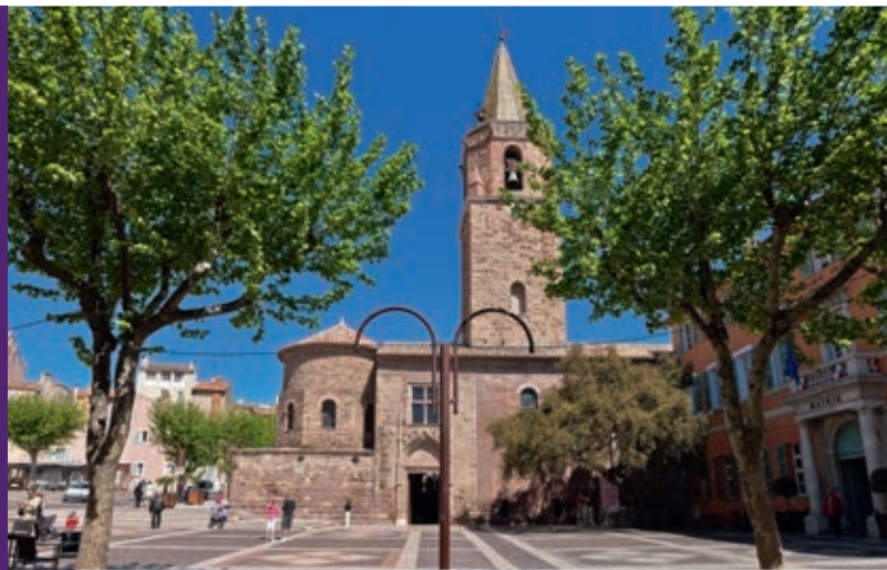
Beaux moments de détente en terrasse Place Formigé, à 500 m*