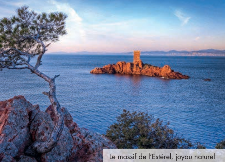
Le massif de l'Estérel, joyau naturel