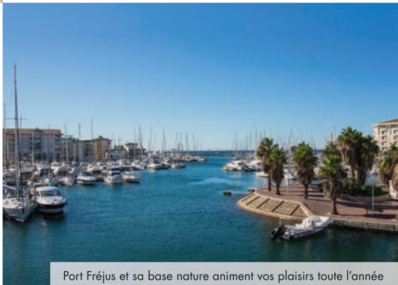
Port Fréjus et sa base nature animent vos plaisirs toute l'année