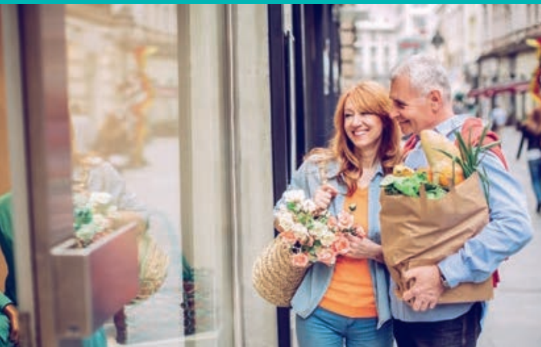
À 300 m*, le marché provençal le mercredi et le samedi