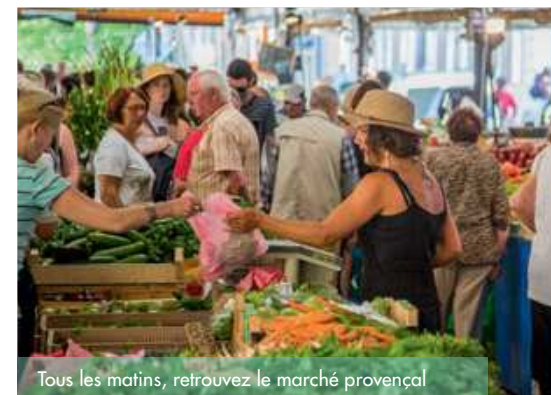
Tous les matins, retrouvez le marché provençal