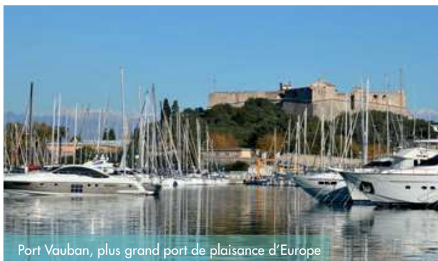
Port Vauban, plus grand port de plaisance d'Europe

« Une adresse idéale entre plaisirs et commodités »