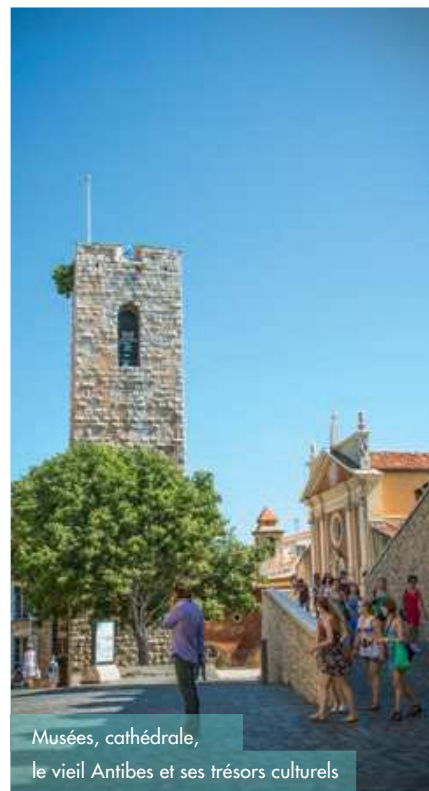
Musées, cathédrale, le vieil Antibes et ses trésors culturels