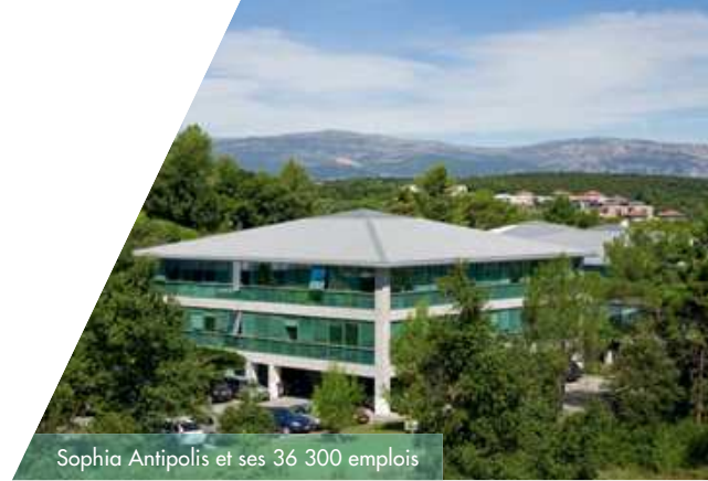
Sophia Antipolis et ses 36 300 emplois