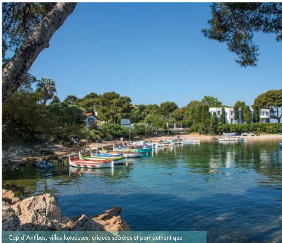
Cap d'Antibes, villas luxueuses, criques secrètes et port authentique