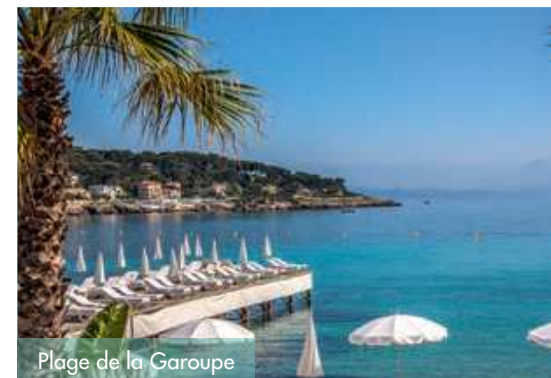
Plage de la Garoupe