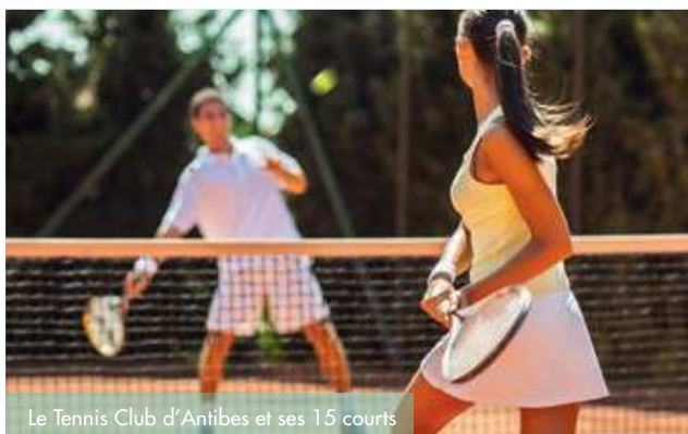
Le Tennis Club d'Antibes et ses 15 courts