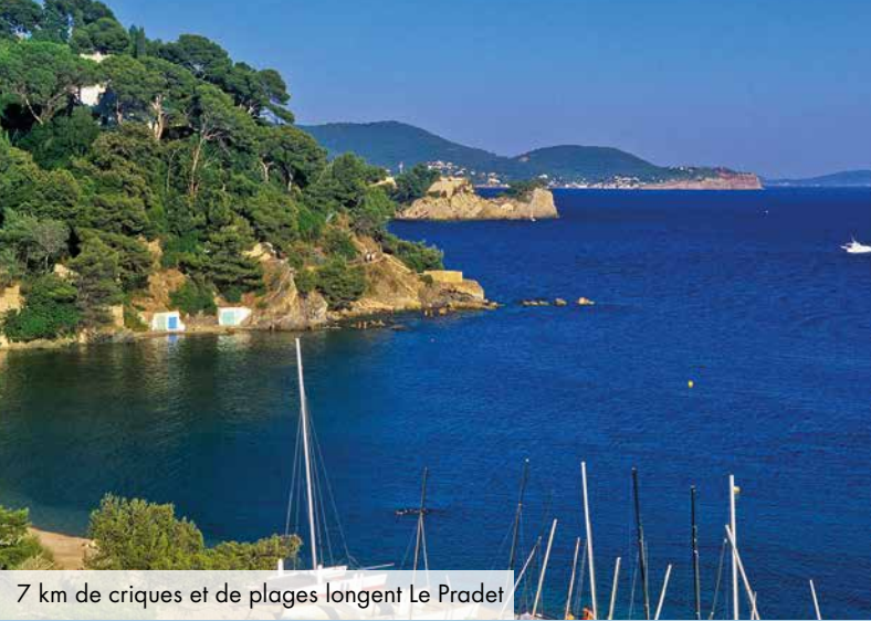
7 km de criques et de plages longent Le Pradet