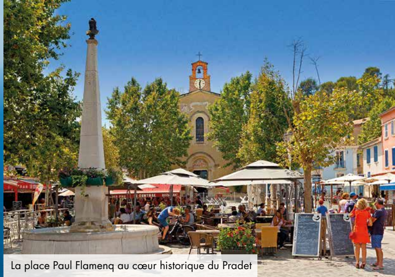
La place Paul Flamenq au cœur historique du Pradet