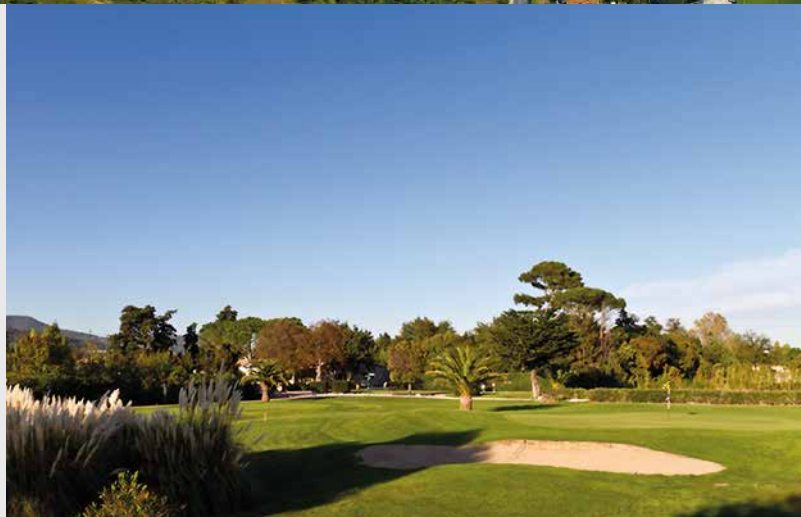
Le golf 18 trous de Valgarde à 10 min en voiture

avec plus de 27 000 entreprises et 165 000 emplois sur la métropole, près de 15 000 étudiants et des centres de recherche de renom (Ifremer, CNRS - INSU...).