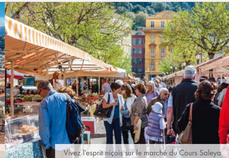
Vivez l'esprit niçois sur le marché du Cours Saleya