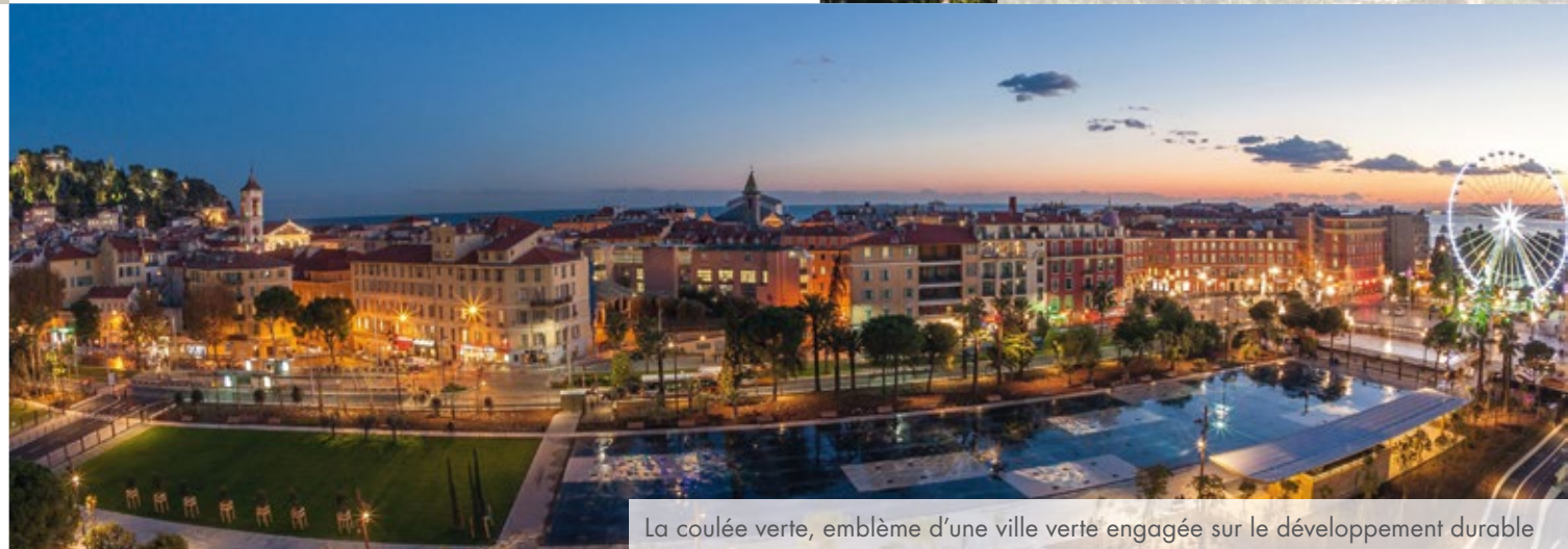
La coulée verte, emblème d'une ville verte engagée sur le développement durable