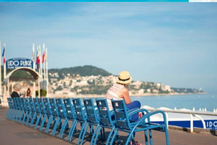
Les chaises bleues, symboles de tout un art de vivre

« Face à la Baie des Anges, votre adresse exclusive et si prisée, pour savourer toute la quintessence de la Côte d'Azur. »