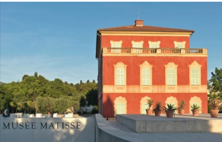
Le musée Matisse à Cimiez