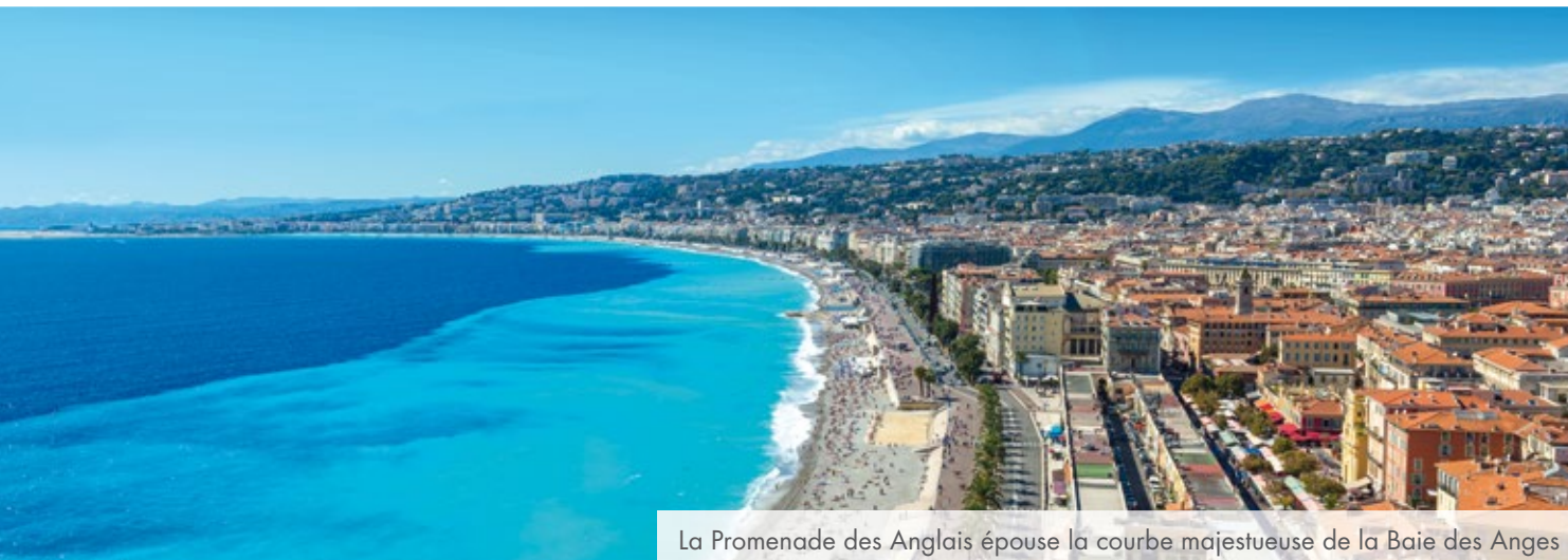
La Promenade des Anglais épouse la courbe majestueuse de la Baie des Anges