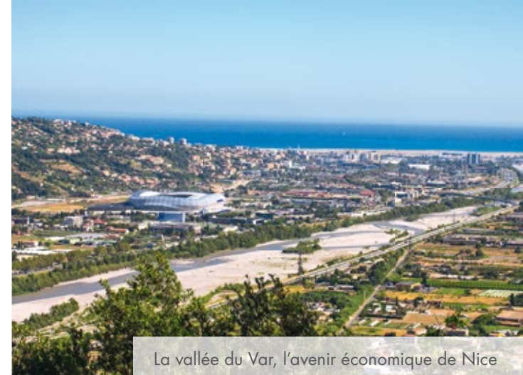
La vallée du Var, l'avenir économique de Nice