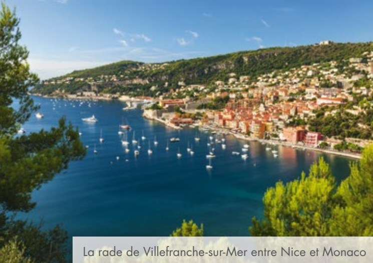
La rade de Villefranche-sur-Mer entre Nice et Monaco